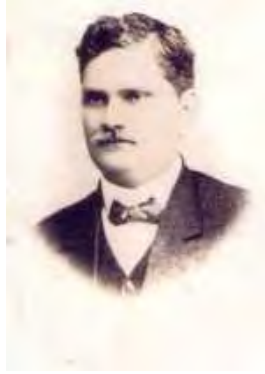
General Celio Barreto Guerrero

“Muy corta su vida, pero de incansable y duro batallar. Amó entrañablemente la libertad, y sintió dentro de su pecho el odio acérrimo a la tiranía.. Encarcelado unas veces, desterrado otras, y perseguido casi siempre, no desmayó en sus propósitos de contribuir, aun a costa de su sangre, a la salvación de su patria.”